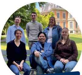
Absolvent*innen Dirigierkurs 2024/25

Die Ausbildungsplätze der Dirigierkurse waren sehr begehrt, Ende August 2025 starteten 12 Teilnehmende in der Unter- bzw. Mittelstufe ihre Ausbildung in Winterthur. Im Zuge des ausgebuchten Kursangebots mussten im Bereich der praktischen Ausbildung weitere Vereinsabende organisiert werden. Wir danken den 12 Vereinen, darunter auch eine Brass Band und zwei Jugendmusikvereine, die ihre Türen öffneten!