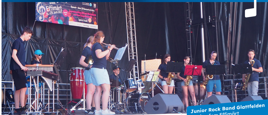
Junior Rock Band Glattfelden Musig ufem Effimärt