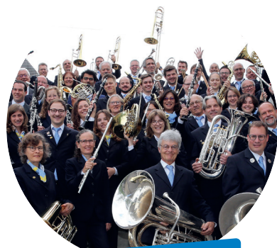
Musikverein Harmonie Eintracht Männedorf

Nun wünschen wir euch eine gemütliche Delegiertenversammlung und einen schönen Samstag in Männedorf!