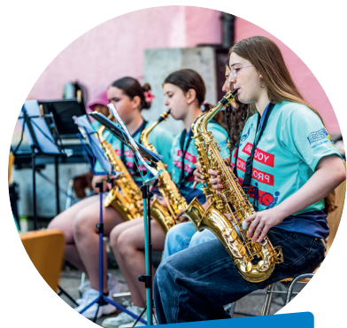
Youth Band Limmattaler Musikschulen

Im Jahr 2025 konnten mehrere Musikvereine im Kanton Zürich ein hohes Jubiläum feiern. Einige gestalteten ihr Festjahr mit zahlreichen Anlässen über mehrere Monate, andere realisierten mit grossen mehrtägigen Festen eindrucksvolle Events. Der ZBV dankt den Jubiläumsvereinen herzlich für die Einladungen sowie für ihren grossen Einsatz und ihr Engagement.