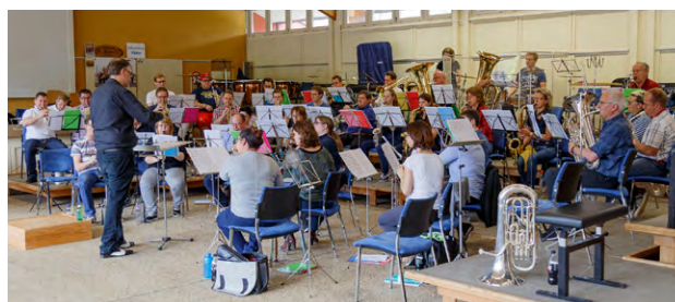
Dirigieren mit dem Ad-Hoc Orchester

Zu den stufenübergreifenden Einheiten gehören ebenso die Vereinsabende und Ad-Hoc Orchester Nachmittage, bei denen die Teilnehmenden essentielle Erfahrungen vor verschiedenen Orchestern sammeln können. Insgesamt haben die Teilnehmenden dieses Jahr 12 mal die Gelegenheit, konkrete Erfahrungen mit verschiedenen Klangkörpern zu sammeln. Wir danken der Stadtmusik Zürich, den Musikvereinen Dietlikon und Richterswil Samstagern, den Musikgesellschaften Niederhasli und Fehraltorf, sowie den Stadtjugendmusiken Illnau-Effretikon und Dietlikon, dass sie eine Probe für unsere Ausbildung zur Verfügung stellen und so einen wichtigen Beitrag zur Nachwuchsförderung leisten. Ein spezieller Dank gebührt dem Musikverein Zürich-Höngg, durch dessen Initiative unsere