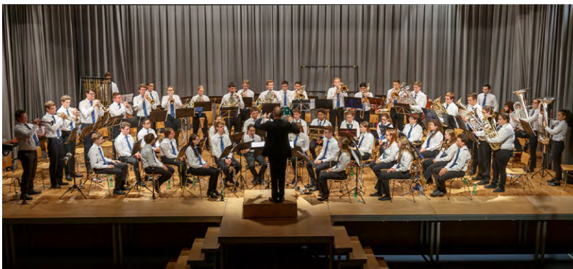
Das Zürcher Jugendblasorchester u25 anlässlich des Abschlusskonzertes der Lagerwoche 2017 in Stein am Rhein