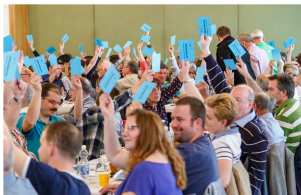
Delegiertenversammlung 2017 in Schlieren

Die DV 2019 ist gesetzt auf den 6.4.2019 – der Veranstalter fehlt uns immer noch! Damit im April die Wahl des neuen Durchführungsortes erfolgen kann, hoffen wir auf ein umgehendes Angebot und stehen für Auskünfte gerne zur Verfügung!