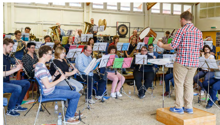
Abschlussprüfungen der Dirigentenkurse 2017 mit dem Adhoc-Orchester

Informieren möchte ich aber bereits darüber, dass ab Herbst 2018 eine Neuauflage unserer Dirigentenausbildungen stattfinden und potentielle AnwärterInnen darum bereits jetzt den Terminkalender konsultieren, ihr berufliches Engagement entsprechend planen und sich bei ihren Stammvereinen darüber erkundigen können, inwiefern eine finanzielle Beteiligung an den Kurskosten möglich wäre. Dadurch könnten im Gegenzug Vizedirigenten- und Registerleiterstellen aus den eigenen Reihen besetzt werden. Im Anbetracht