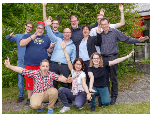
Absolventinnen und Absolventen des Dirigentenkurses 2016/17